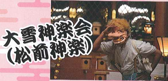
大雪神楽会 (松前神楽)