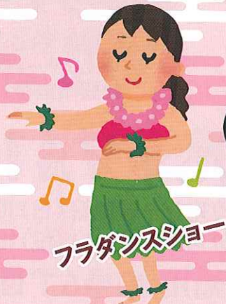
フラダンスショー