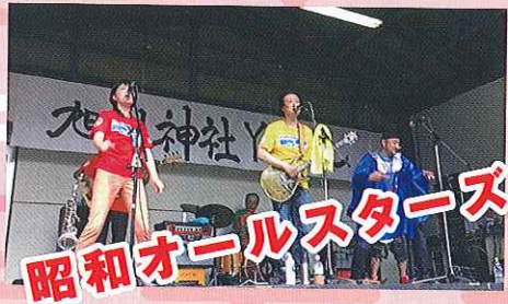
昭和オールスターズ